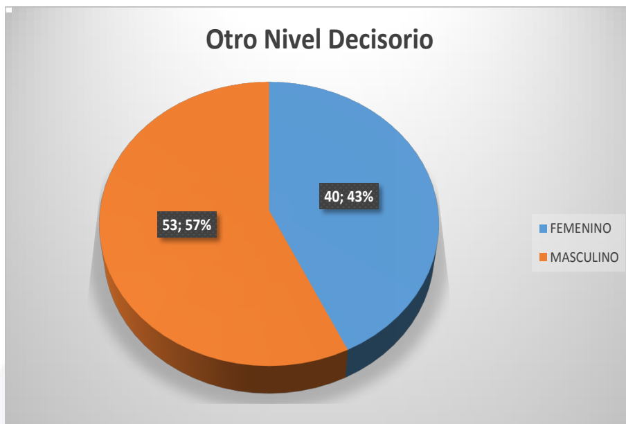
Gráfico 3: Ley de Cuotas cargos Otro Nivel Decisorio