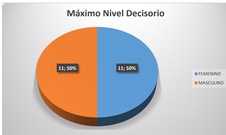
Gráfico 2: Ley de Cuotas Cargos Máximo Nivel Decisorio